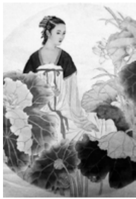
Wang Zhenyi 1768 Astrònoma