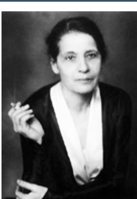
Lise Meitner 1878 Física Nuclear