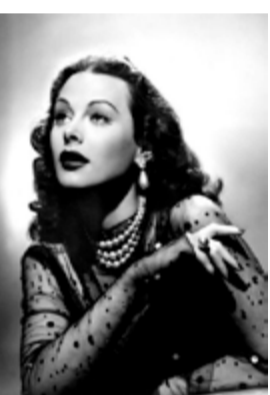
Hedy Lamarr 1914 Actriu