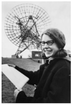
Jocelyn Bell Burnell 1943 Astrofísica