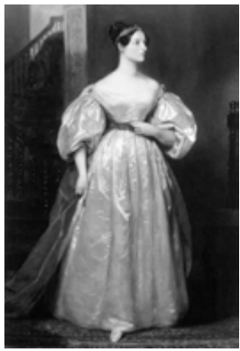
Ada Lovelace Byron 1815 Matemàtica i Física