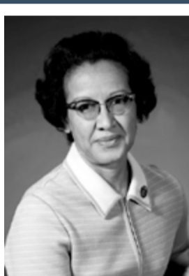
Katherine Johnson 1918 Física