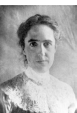
Henrietta Leavitt 1868 Astrònoma