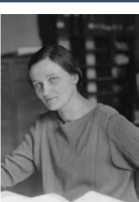
Cecilia Payne-Gaposchkin 1900 Astrofísica