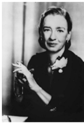
Grace Hopper 1906 Informàtica i militar