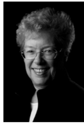
Sandra Faber 1944 Astrofísica