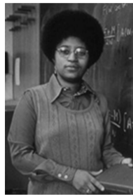
Shirley Ann Jackson 1946 Física Nuclear