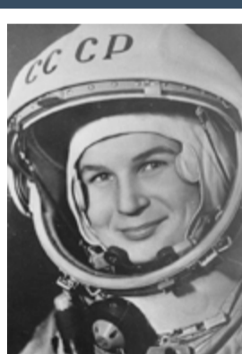
Valentina Tereshkova 1937 Cosmonauta