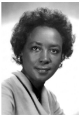
Annie Easley 1933 Enginyera