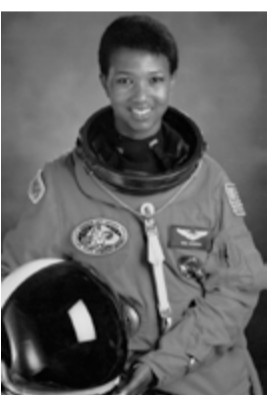
Mae Jemison 1956 Astronauta