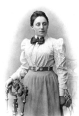
Emmy Noether 1882 Matemàtica