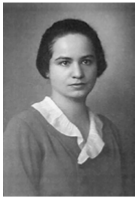
Marietta Blau 1894 Física