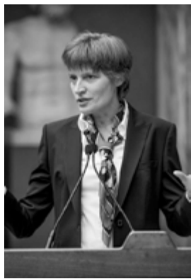
Lene Hau 1959 Física