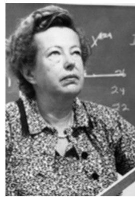
Maria Goeppert-Mayer 1906 Física teòrica