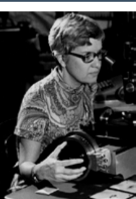
Vera Rubin 1928 Astrònoma