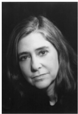
Margaret Hamilton 1936 Informàtica