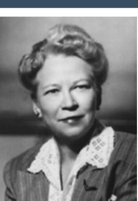
Edith Hinkley Quimby 1891 Física nuclear